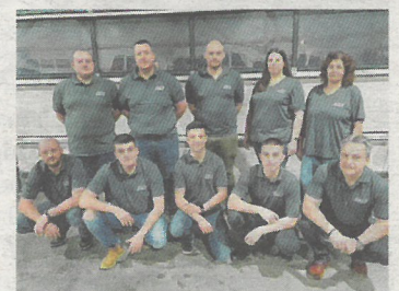
Die Profis der Metalltechnik Kainz GmbH.

Ihre Projekte werden mit jahrelanger Erfahrung und mit einem kompetenten Team umgesetzt. Wir verarbeiten Edelstahl, Aluminium und Stahl. Unsere Kunden bekommen bequem alles aus einer Hand: Von der Planung mittels 3D-Zeichnung über die Fertigung bis hin zur Montage. Unser Leistungsspektrum ist sehr vielseitig: Geländer, Sichtschutz, Überdachungen, Vordächer, Stiegen,