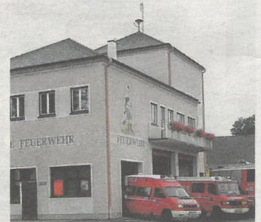
Wenn andere frei haben, stehen sie für uns bereit.

von Ferdinand Dangl noch einmal – um Hausinventar zu retten – in das brennende Wohngebäude lief. Das in Flammen stehende Strohdach rutschte ab und begrub die Frau unter sich. Alle Rettungsversuche scheiterten. Aus Anlass des 25-jährigen Bestandsjubiläums der FF Gastern im Jahr 1909 fand erstmals der Bezirksfeuerwehrtag in Gastern statt. Der Ankauf eines zweiten Feuerlöschgerätes (Doppelkolbenpumpe) dürfte zu diesem Anlass getätigt worden sein. Am 27. März 1964 wurde eine Alarmsirene auf dem Dach des Schlauchturms montiert, weil sich die bis dahin gepflogene Alarmierung durch Hornsignal als zunehmend unzulänglich erwiesen hatte. Mitte Juni 1964 wurde das Funkgerät der Type Cambridge in der Landesfeuerweherschule Tulln in das Einsatzfahrzeug eingebaut.